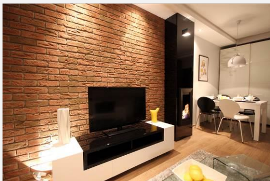
Płytki cegłopodobna Stegu – Country 640

Wysokie sufity, wielkie okna i oczywiście charakterystyczne ceglane lub betonowe ściany – to cechy pomieszczeń urządzonych w stylu loftu. Wnętrza zaaranżowane w ten sposób stały się niezwykle popularne i coraz częściej możemy zaobserwować inspirację tym stylem zarówno w restauracjach, galeriach sztuki, jak i prywatnych domach. Skąd wzięta się moda na lofty? Mieszkania tego typu zaczęły powstawać w latach 60-tych w Stanach Zjednoczonych w starych, przemysłowych budynkach. To właśnie takie miejsca stały się punktem wyjścia dla zdefiniowania stylu aranżacyjnego określanego jako loftowy, a kojarzonego powszechnie z surowym, industrialnym charakterem. Nie musimy jednak wprowadzić się do nieczynnej fabryki, aby stworzyć przestrzeń w tym klimacie – jeśli podoba nam się ten trend, z powodzeniem możemy w ten sposób urządzić nasze mieszkanie.