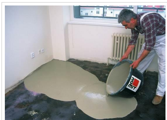
Podłoże pod panele warto wyrównać masą samopoziomującą.

SuperPrimer (trudne i niechłonne), a ewentualne uszkodzenia naprawić za pomocą zaprawy wyrównującej Baumit Preciso.