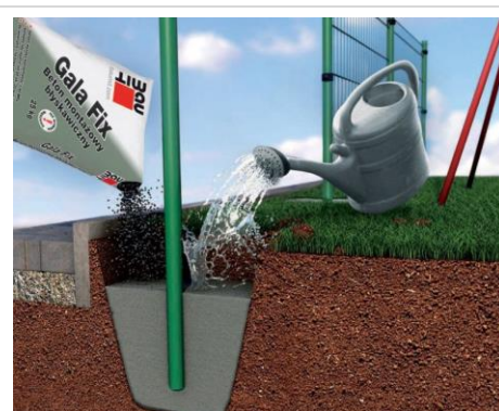
Mocowanie słupka ogrodzeniowego przy pomocy Baumit Gala Fix .

To świetna opcja, gdy mamy do wykonania drobne prace w domu czy ogrodzie. Warto z niej skorzystać szczególnie przy montażu słupków ogrodzeniowych, ławek, lamp ogrodowych, huśtawek, suszarek na ubrania czy altan.