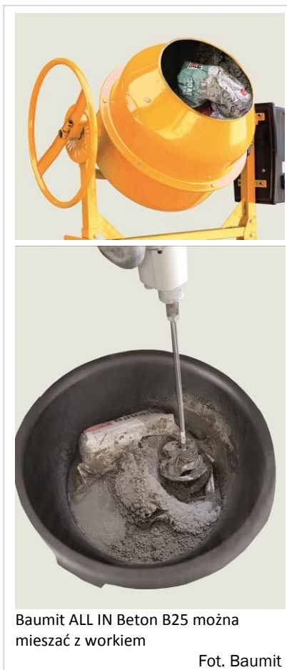
Baumit ALL IN Beton B25 można mieszać z workiem