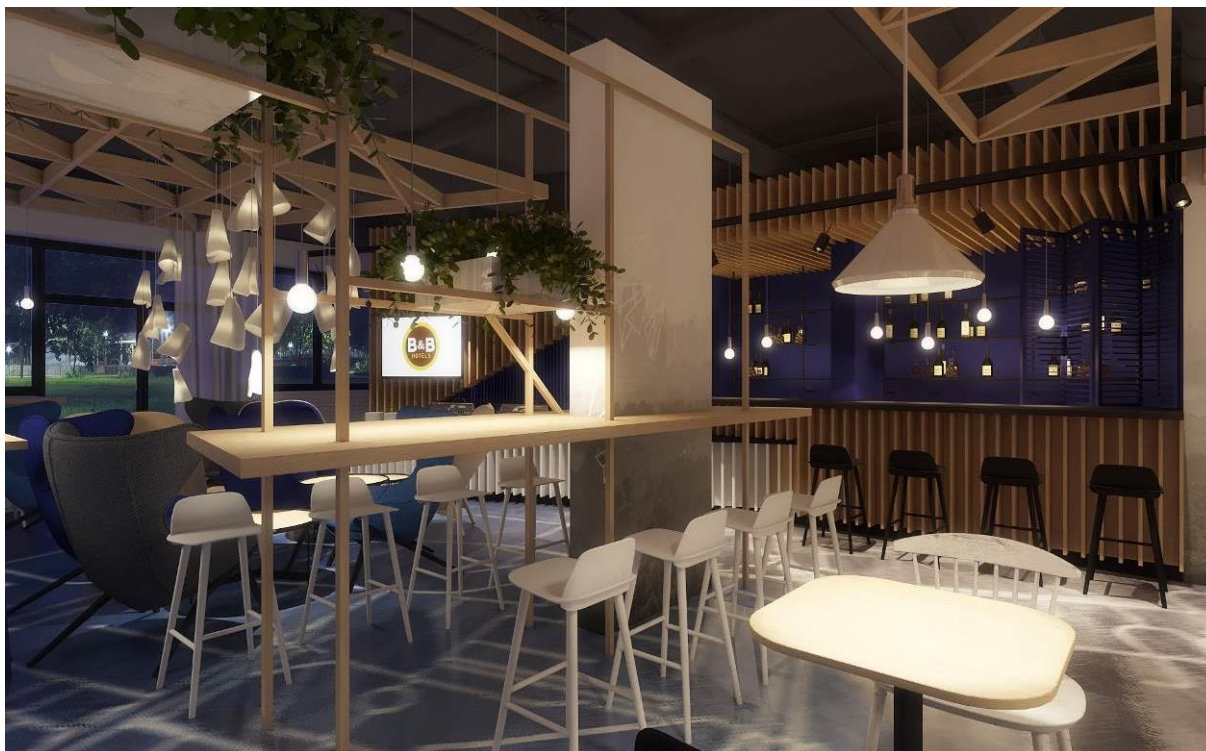
Hotel B&B Warszawa-Okęcie – lobby