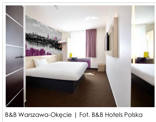
B&B Warszawa-Okęcie

naprawdę robi wrażenie. Jestem przekonana, że nowy wystrój wnętrz spodoba się gościom i wpłynie na większy komfort pobytu w naszym warszawskim hotelu. Zapraszam do odwiedzenia hotelu B&B w Warszawie. Warto sprawdzić jak nowoczesny design zmienił wygląd hotelu i przetestować zmodernizowane, jeszcze wygodniejsze pokoje – podsumowuje Beatrice Bouchet, Prezes Zarządu B&B Hotels Polska.