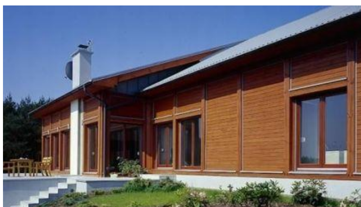
Elewacja budynku przesądza o estetyce domu, nadając mu niepowtarzalny charakter

„Fasada budynku, odpowiednio zgrana z całościowym zamysłem architektonicznym, odgrywa pierwszoplanową rolę w aranżacji zewnętrznej części domu. Jako najbardziej widoczny element wykończenia przesądza o estetyce i ostatecznym charakterze budynku, nadając mu unikalną formę. Z tego względu inwestorom zależy na takim doborze materiałów, za sprawą których podniosą walory i atrakcyjność domu bądź podjętej inwestycji, a