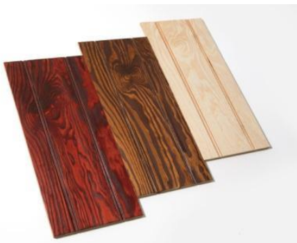
Barwa sklejki podkreśli charakter budynku, uwydatniając jego bryłę i styl

Dostępność sklejki elewacyjnej w arkuszach pozwala z łatwością dostosowywać jej wielkości i kształt do indywidualnych potrzeb. Duży format płyt wpływa również na większą estetykę, poprzez uniknięcie pionowych podziałów, natomiast końcowy efekt aranżacji fasady budynku z wykorzystaniem sklejki elewacyjnej zależy już wyłącznie od pomysłowości i inwencji wykonawcy. Firma SKLEJKA-EKO S.A. udostępni arkusze zarówno w naturalnym kolorze, jak i wykończone dowolnym odcieniem lakierów, również transparentnych, które w niebanalny