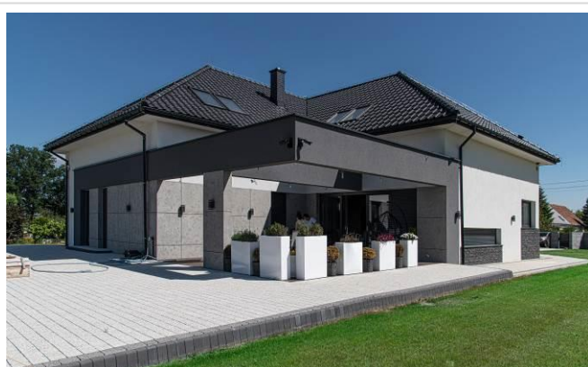
Efekt betonu uzyskany dzięki zastosowaniu tynku modelowanego Baumit CreativTop

Wybierając konkretny produkt z dostępnej oferty rynkowej, nie zapominajmy o użytecznych aspektach wykończenia budynku – tylko jego wysoka jakość pozwoli cieszyć się trwałym efektem dekoracyjnym przez lata. Silikonowy tynk modelowany Baumit CreativTop od tego roku występuje w nowej formule. Produkt został wzbogacony o innowacyjny wypełniacz, który niczym koralowiec posiada tysiące maleńkich porów i dysponuje nadzwyczaj dużą powierzchnią. Ta ekstremalnie drobna mikrostruktura wewnątrz odpowiada za efekt „drypor” . Na czym on polega? Już wyjaśniamy.