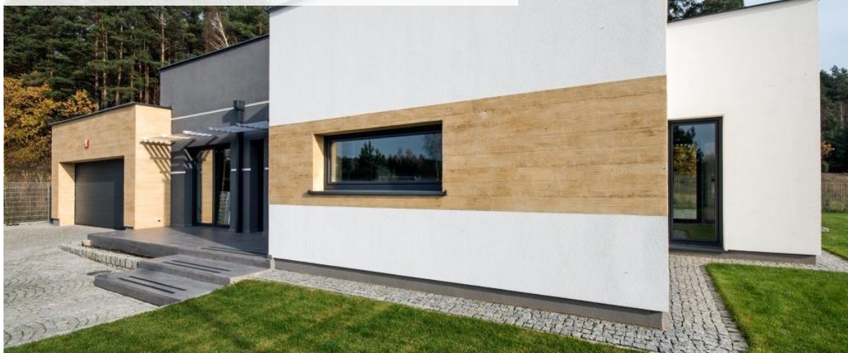
Motyw drewna można bez trudu uzyskać przy użyciu tynku modelowanego

Każdy chce, aby jego dom wyglądał jak z obrazka. Realizując marzenie o własnych czterech kątach staramy się więc, aby elewacja była niepowtarzalna i gwarantowała wyjątkowe doznania estetyczne, a zarazem tworzyła niezwykle klimat miejsca, sprzyjający wypoczynkowi na świeżym powietrzu. Poświęcamy sporo uwagi, by wybrać odpowiednie wykończenie budynku, coraz częściej poszukując odwołań do samej natury.